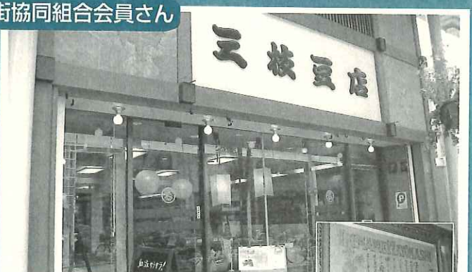
店内には歴史を感じる当時の包装紙も飾ってあります