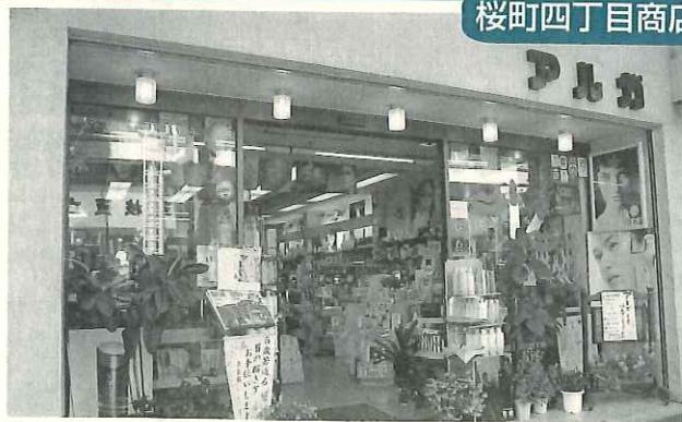
▲お客様一人一人に丁寧なサービスを心がけています