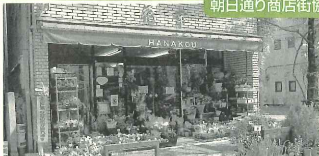
▲バラも種類豊富に用意されています。お気軽にお越し下さい