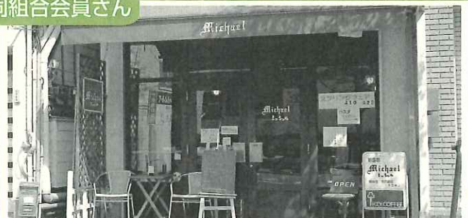
▲明るくきれいな商店街の中でおいしい料理を楽しみませんか

今人気なのは、小鉢を3,4種類使って装飾した鉢物、寄せ鉢で、中に観葉植物を交えた寄せ鉢も好まれているそうです。また、ウェディングブーケやテーブルフラワーなどとして利用され、枯れないなどのメリットから、女性を中心に人気のあるプリザーブドフラワーを県内でもいち早く取り入れ、注目されています。